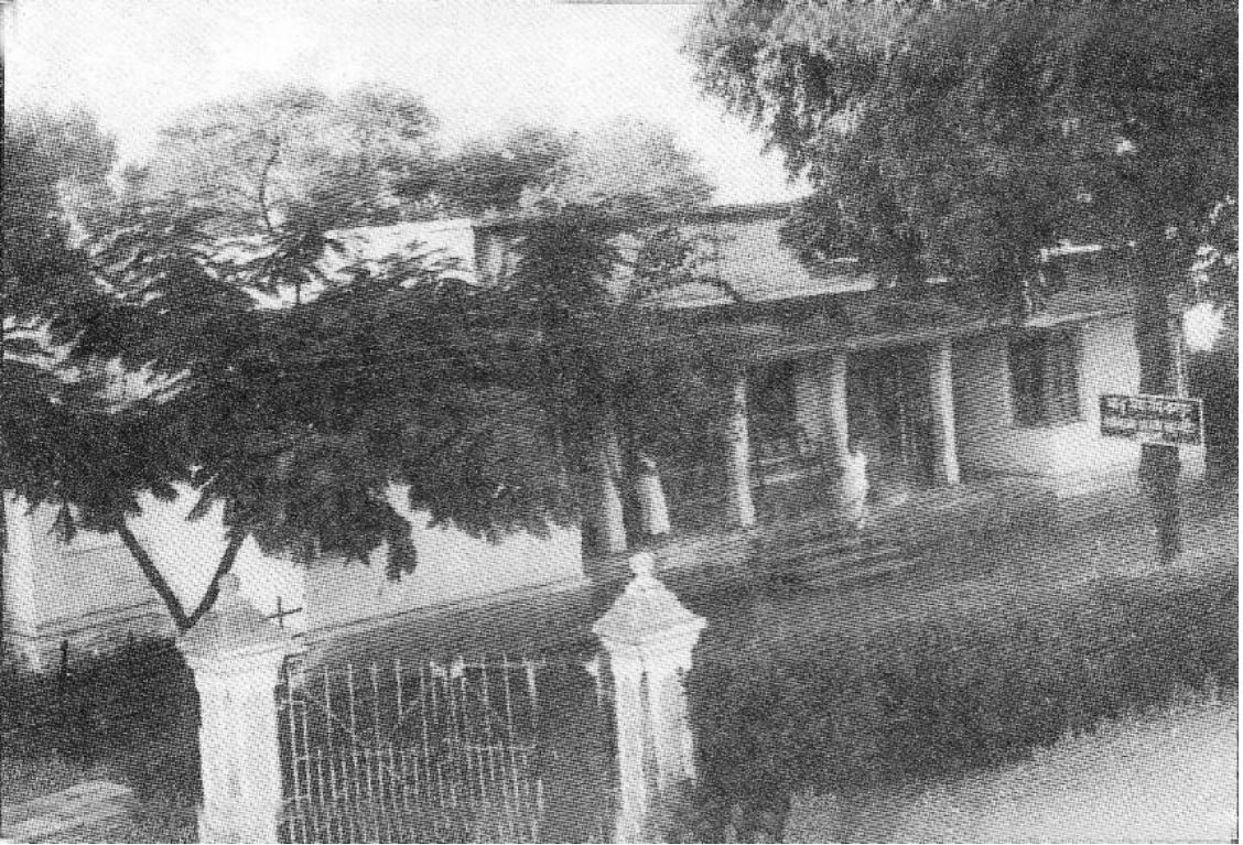
जयदेव प्रसाद भास्कर मातृमंदिर, चांदूर रेल्वे